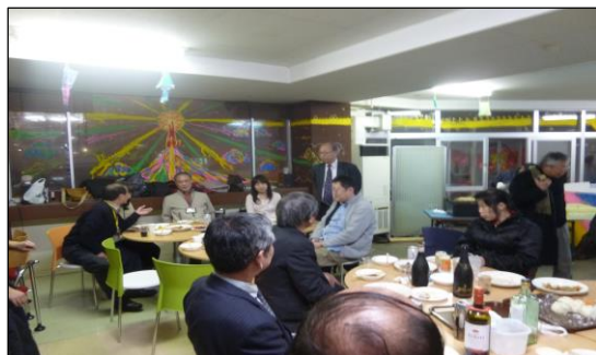
※入居者忘年会(12/7)での一コマ